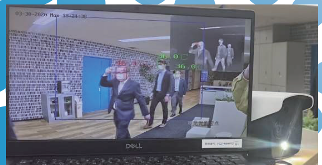
歩きながらの検温