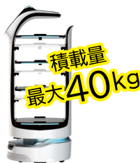
取りはずし可能トレイ

細かい作業を集中して行いたいので、細々と物を運ぶことで気持ちが散漫になっていました。ロボットが運ぶことで体力的にも精神的にも楽になった気がします。すれ違うときもスムーズに避けていくのでびっくり。かわいい声にも癒されます。